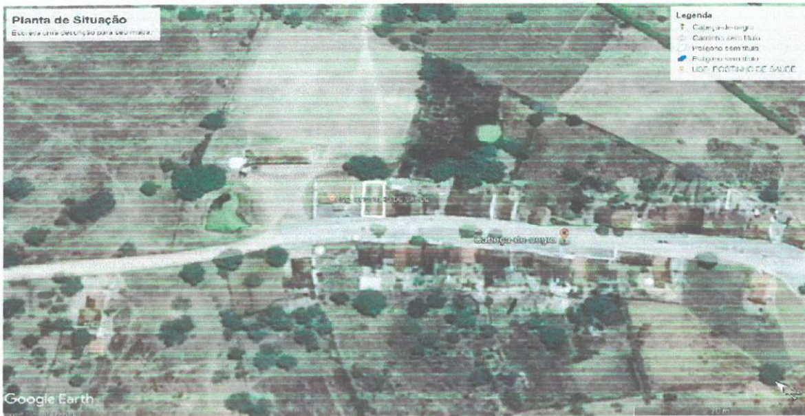
Figura 1: Imagem aérea do terreno